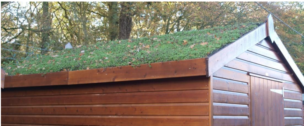
Voorbeeld afwerking dakrand, grind zal overgroeien zodat het niet meer zichtbaar is