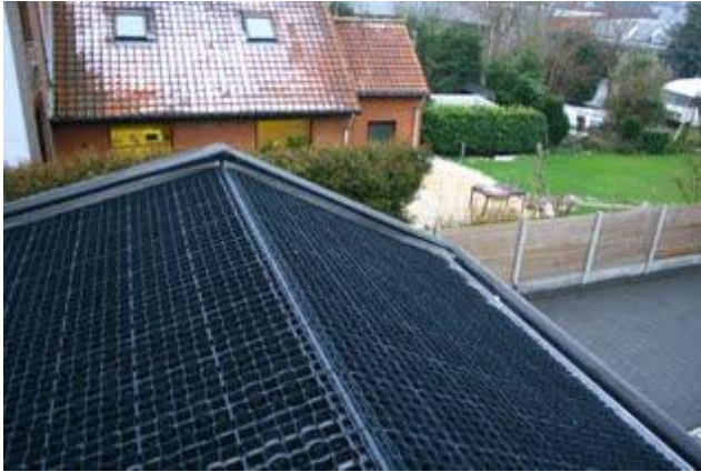
voorbeeld bij de nok